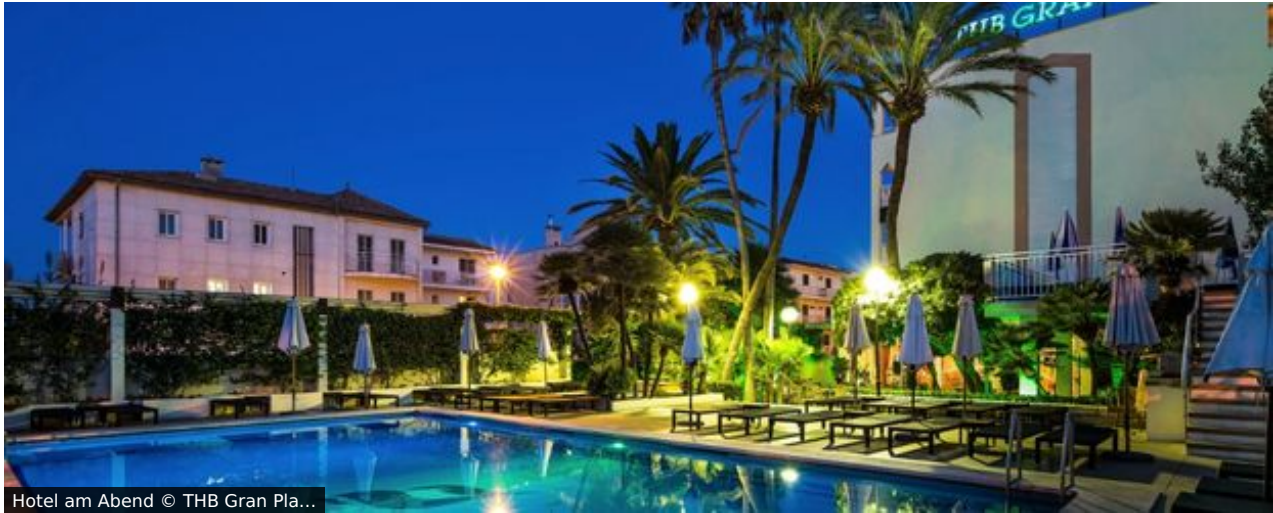
Hotel am Abend