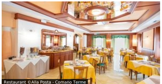
Restaurant ©Alla Posta - Comano Terme