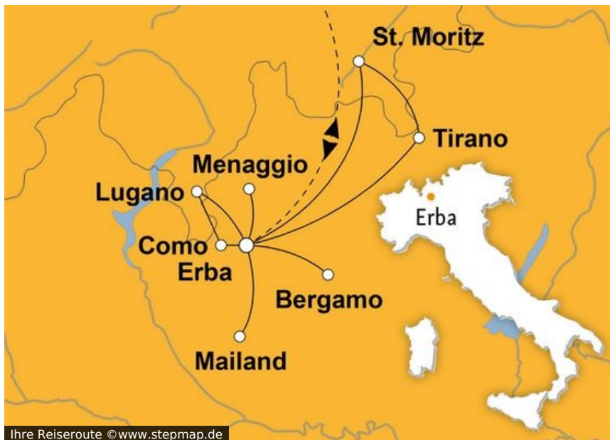
Ihre Reiseroute

Was haben Brad Pitt, Madonna, George Clooney und Konrad Adenauer gemeinsam? Sie alle liebten oder lieben den Comer See. „Klein-Hollywood“ ist die Gegend aber auch, weil sie Filmen wie Casino Royale, Star Wars, Ocean's 12 und vielen anderen als Kulisse diente.