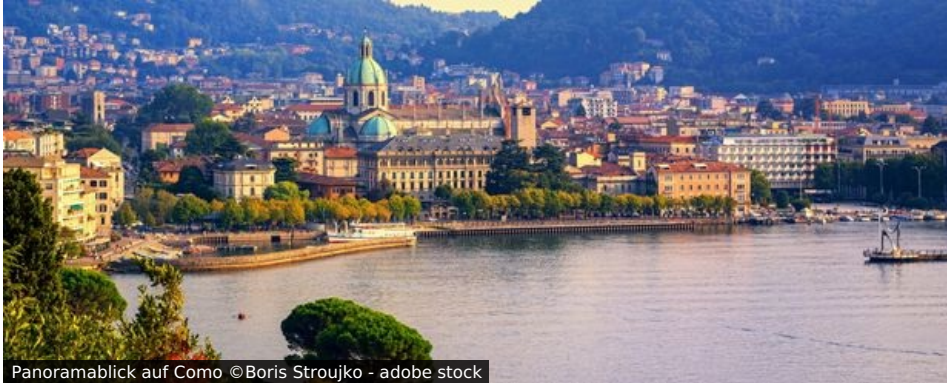
Panoramablick auf Como