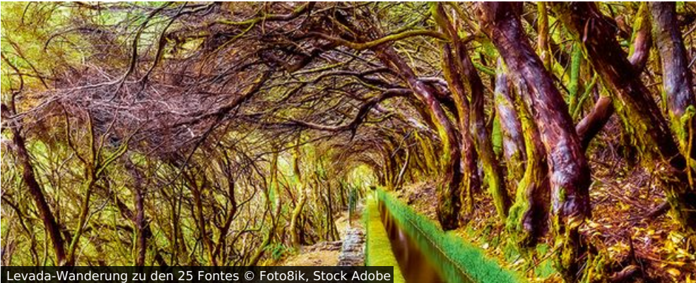
Levada-Wanderung zu den 25 Fontes