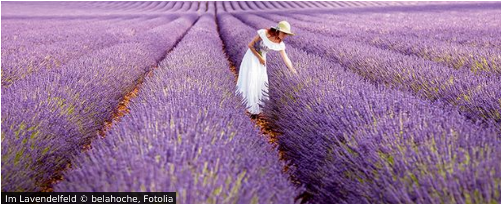
Im Lavendelfeld